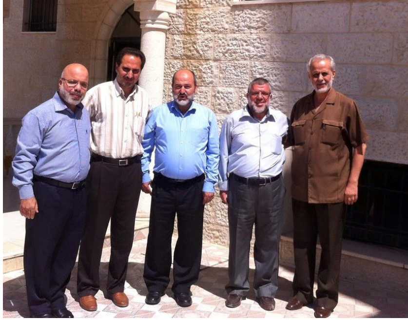
צ'צ'ור ואנשי התנועה האסלאמית עם מנהיג חמאס ביו"ש חסן יוסף