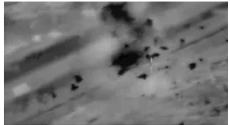
חטיפרעים מניחים מטענים בגדר המערכת בין ישראל לעזה