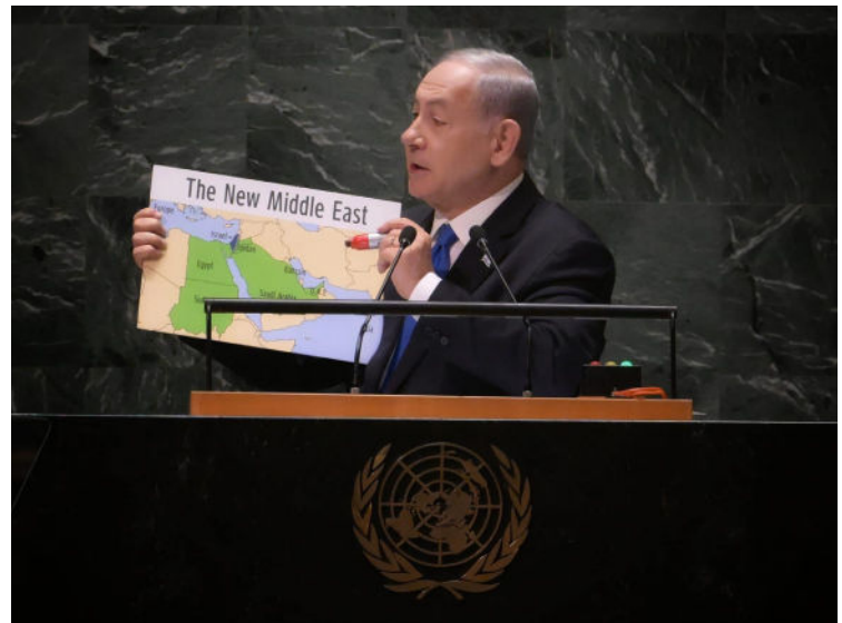
ראש הממשלה בנימין נתניהו נואם בפני העצרת הכללית של האו"ם, 22 בספטמבר 2023

יתרה מזאת, נורמליזציה מול ישראל עשויה להביא עימה יתרונות לא מבוטלים עבור הממלכה הסעודית בדמות שיתופי פעולה בתחומים אזרחיים, כגון, סייבר, טכנולוגיה, מים ומסחר. בנוסף, לערב הסעודית יש אינטרס ברור בהשבת יחסיה עם ארה"ב למסלולם התקין. נורמליזציה עם ישראל תחזק מן הסתם את מעמדה בווינגטון ואת יחסיה עם הממשל האמריקאי. בן סלמאן רואה בישראל אמצעי לקידום הסרת החרם האמריקאי על מכירת מערכות נשק מתקדמות לממלכה, בייחוד נוכח התקדמותה של תוכנית הגרעין הצבאית של איראן. מבחינת ישראל, הסכם נורמליזציה עם ערב הסעודית עשוי לסמן את סופו של הקונפליקט של ישראל עם העולם הערבי, מתוקף מעמדה של ערב הסעודית כמנהיגת העולם הסוני – מעמדה זה פקטו בקרב מדינות ערב ובמזרח התיכון. הסכם כזה יוכל להוביל לעוד "6-7 הסכמים דומים" עם מדינות ערביות ומוסלמיות נוספות, על פי שר החוץ הישראלי, אלי כהן, ויוכל להסיט את הסוגייה הישראלית-פלסטינית ממרכז זירת יחסי החוץ של ישראל במזרח התיכון אל שוליה.