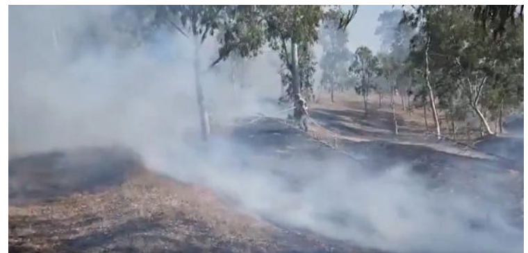
שריפה שפרצה כמועצה האזורית שער הנגב, שבעוטף עזה, כתוצאה מהפרחת בלוני הנפץ