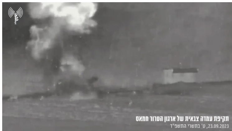
תקיפת עמדה צבאית של ארגון הטרור חמאס ט' בתשרי התשפ"ד, 23.09.2023

• שר התיירות הישראלי חיים כץ ערך ביקור רשמי היסטורי ראשון של שר ישראלי בריאד כדי להשתתף בבסס עולמי של ארגון התיירות של האו"ם. שר התקשורת קרעי וח"כ דויד ביטן צפויים אף הם להגיע לסעודיה במהלך השבוע הראשון של אוקטובר.