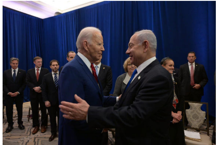
ראש הממשלה נתניהו נפגש עם נשיא ארה"ב ג'ו ביידן בניו יורק, 20 בספטמבר, 2023