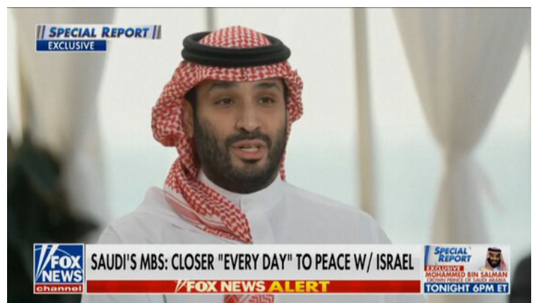
יורש העצר הסעודי מוחמד בן סלמאן (MBS) בראיון לברט באייר בתוכנית "דו"ח מיוחד" | מקור: פוקס ניוז