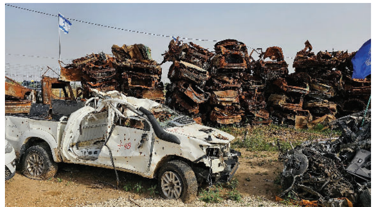
חניון הרכבים השרופים, מושב תקומה

הלחץ הבינ"ל על ישראל לחתור להפסקת אש ולהקים מדינה פלסטינית מנותק מהמציאות המזרח תיכונית. פרס לטרור בדמות מדינה פלסטינית יחליש משמעותית את ביטחון ישראל.