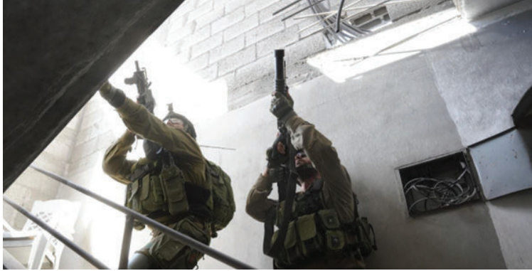
לוחמי צה"ל בעזה