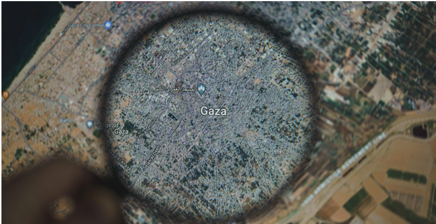
רצועת עזה

קווים מנחים להמשך המערכה לעבר ניצחון מלחמת חרבות ברזל