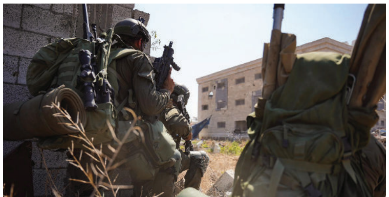
לוחמי צה"ל בעזה