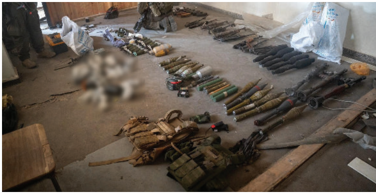
אמל"ח שהוחרם בעזה על ידי לוחמי צה"ל