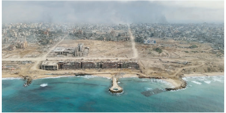
רצועת עזה

המישור הבינ"ל: שירות טוב למדינת ישראל יהיה שילוב גורמים בינ"ל בשיקום הרצועה וניהול אזרחי של חיי היומיום, כולל מדינות ערב הפרגמטיות באיזור, ארה"ב, צרפת וגורמים אחרים. המהלך יגביר את הלגיטימציה של המהלכים הישראליים ויחלק את עומס הביקורת הבינ"ל בין הגורמים האחרים, באופן שלא יתמקד בלעדית בישראל. מהלך זה יתאפשר אך ורק בכפוף לאינטרס הישראלי ובהסכמת גורמים ישראליים. האז"ם איננו גורם מועדף לאור הרקורד הבעייתי שלו כלפי הסכסוך, ההטייה כלפי ישראל והתגייסות המערכות שלו לייצור תעמולה כוזבת, העברת החלטות סיטונאית נגד ישראל והפעלת לחץ שלילי על ישראל בזמן מלחמה.