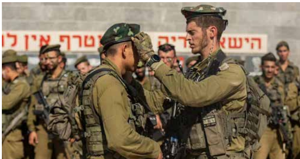
לוחמי גדוד נצח יהודה מחזור מרץ 4202 בטקס סיום מסע כומתה

וועדת נומה – וועדה שהוקמה בשנת 2019 לבדוק את נתוני גיוס החרדים לצה"ל במהלך השנים שקדמו לה, לאור חשש לפערים. בשנת 2020 חשפה הוועדה כי התבצעה טעות באיסוף הנתונים הנוגעים למתגייסים החרדים, שהגדילו אותם פי 3 מהגיוס בפועל. הוועדה המליצה להקים באכ"א מנגנון ספירה מקצועי ושיטתי ועל הצורך בהקמת מאגר מידע דיגיטלי אחוד במשרד הביטחון. בנוסף, הוועדה המליצה על הקמת וועדה מקצועית משותפת של משרד הביטחון, צה"ל ומשרדי הממשלה. לצד זאת, היא סברה כי חובה על הדרג המדיני לגבש אסטרטגיה לאומית-חברתית בנושא.