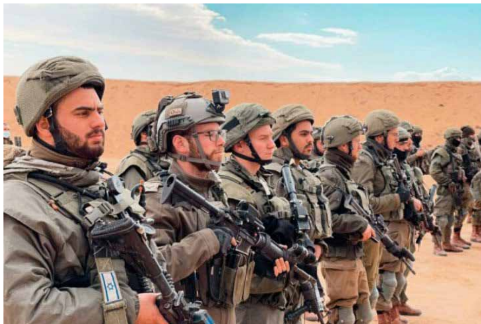
לוחמים בקורס מכי"ם, גדוד נצח יהודה

ראוי להדגיש גם כי למסלולי שירות אלה הייתה השפעה משמעותית על צה"ל - בכך שהם אפשרו גיוון של כוח האדם ושילוב נקודות המבט הייחודיות של הקהילה החרדית. שילוב זה משפר את הגיוון התרבותי והדתי, ומקדם צבא מגובש וייצוגי יותר.