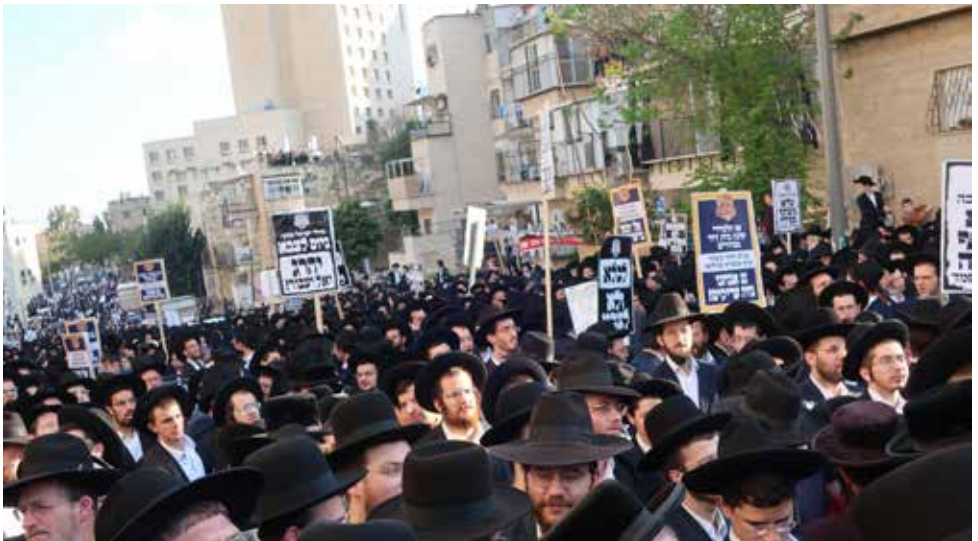
הפגנה במגזר החרדי נגד גיוס לצה"ל

על פי סקר "מדד הביטחוניסטים" שערכנו במאי 2024, בדקנו את התפיסה בקרב כלל הציבור הישראלי לגבי סוגיית גיוס החרדים. 54% מהנשאלים, כולל 47% מהנשאלים החרדים, השיבו שסוגיית גיוס חרדים היא ביטחונית קודם כל ולאחר מכן חברתית; 59% סבורים שגיוס חרדים חייב לבוא לצד גיוס אוכלוסיות אחרות שכיום אינן מתגייסות; 56% סבורים שהפתרון להעלאת אחוזי הגיוס צריך להתמקד קודם כל בחברה החרדית.